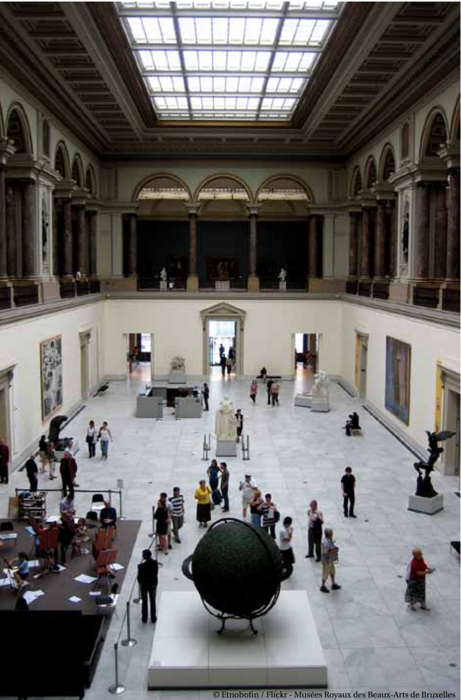
© Etnobofin / Flickr - Musées Royaux des Beaux-Arts de Bruxelles